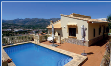
Orba | €249,000 3 bedroom villa