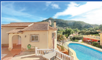
Alcalali | €275,000 2 bedroom villa