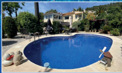
Javea | €439,000 5 bedroom villa