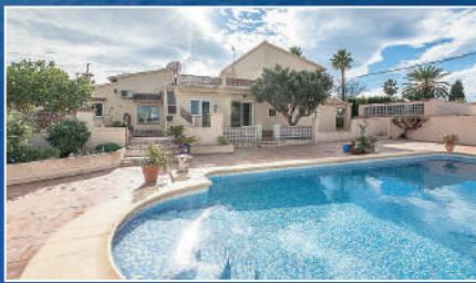
Denia | €495,000 3 bedroom villa