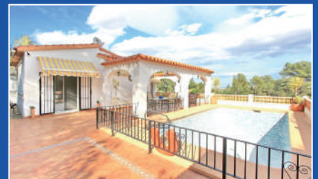
Orba | €290,400 3 bedroom villa

HomeEspaña HomeEspaña hat in den letzten 19 Jahren mehr als 4.000 Kunden geholfen, ein Zuhause an der Costa Blanca zu finden. Wir haben Immobilien, die von Ein-Bett-Apartments am Strand bis hin zu luxuriösen Fincas auf dem Land reichen. Wir begleiten Sie bei jedem Schritt des Weges. Wir finden Ihr Traumhaus, führen Sie durch den Prozess und sorgen für einen reibungslosen und sicheren Kauf.