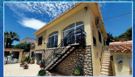
Parcent | €270,000 4 bedroom villa